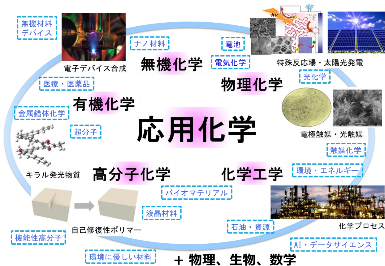
(図1) 応用化学の5つの専門科目群と研究のひろがり

『応用化学』は私たちの社会基盤・生活を支える重要な学問分野です。私たちの生活は、衣類、日用雑貨、医薬品からガソリンなどの燃料まで、様々な化学製品に囲まれています。これら化学製品の開発・生産は、物質変換の原理の解明と化合物の創成、機能と物性の発現メカニズムの解明、社会や生活に役立つ製品やシステムの構築・設計を研究対象としている『応用化学』が支えてきました。これからの社会の発展にも『応用化学』の知見が必要不可欠です。応用化学系は、技術革新に果敢に挑戦し、持続的な社会の構築に貢献する科学技術者・研究者を養成します。