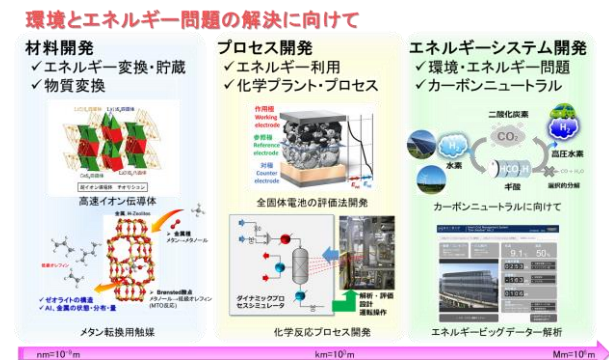
(図5) 化学システム分野の研究

環境とエネルギー問題の解決への貢献に向けて、「材料開発」、「プロセス・デバイス開発」、「システム開発」を追求することで、原子・分子レベルから地球規模までの幅広いマルチスケールで物質・エネルギー変換システムを設計する最先端の化学システム研究に取り組んでいます。