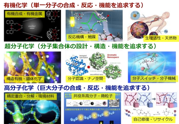
(図3) 分子創成分野の研究

単一分子の合成・反応・機能を追求する「有機化学」、分子集合体の設計・構造・機能を追求する「超分子化学」、巨大分子の合成・反応・機能を追求する「高分子化学」に基づき、有機分子や高分子を自在に設計・合成・創成研究に取り組んでいます。